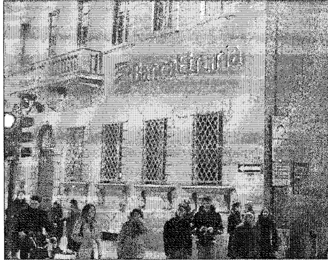
L'impegno dei dipendenti del Gruppo Etruria in favore delle popolazioni colpite dal sisma

"Sosteniamo il progetto città di Treia: ha riportato gravi danni, si contano 1.316 segnalazioni, 302 ordinanze di inagibilità, 683 sfollati. Fra le strutture gravemente colpite anche il Santuario del Santissimo Crocefisso che comprende chiesa e convento. Il Santuario da sempre rappresenta un punto di riferimento per la vita spirituale e sociale, non solo del comune di Treia, ma anche dei comuni vicini, poiché attrae un gran numero di fedeli devoti. Pertanto è stata proposta l'iniziativa di realizzare cassette in legno da collocare in luogo dei locali del Convento e l'allestimento di una nuova struttura per ospitare il Crocefisso. Un prezioso segno di continuità e di vicinanza alle popolazioni duramente provate dal sisma: assicurare ai cittadini treiesi ed ai fedeli dei comuni vicini la possibilità di praticare il culto è un segnale di speranza e di fiducia verso il futuro".